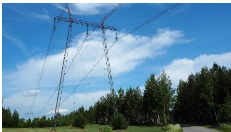
Kuva 4. Kaava-alueen poikki kulkee sähkönsiirtolinja