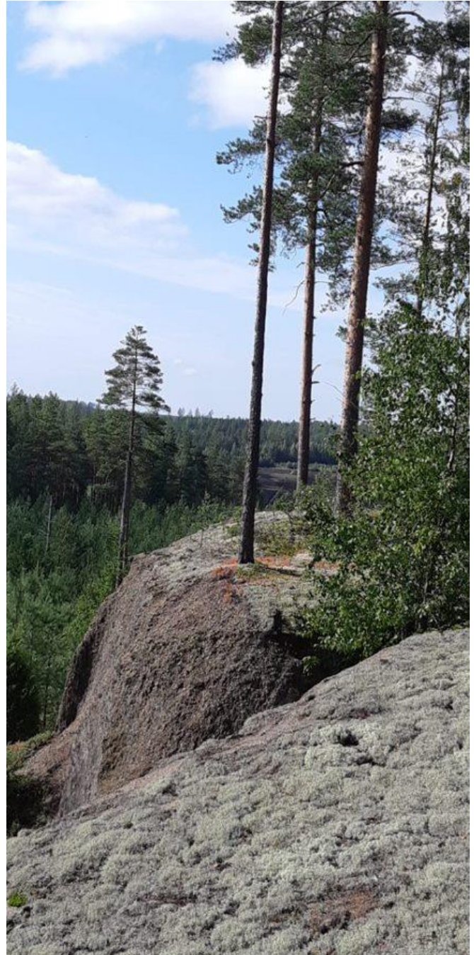
Kuva 3. Tupavuori